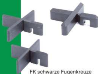
FK schwarze Fugenkreuze