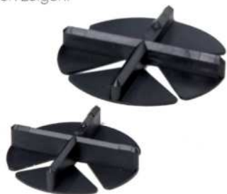
FK-5-UFO und FK-3-UFO Fugenkreuze

klemmen, so dass sie auf dem Planum aufliegen. Der Bedarf an Fugenkreuzen hängt von der Plattengröße und den Verlegemustern ab.