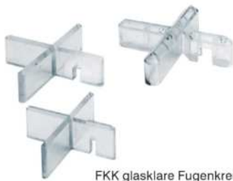
FKK glasklare Fugenkreuze